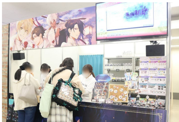
※写真はアニメイトガールズフェスティバル2024の当社ブースです。

イベント名：アニメイトガールズフェスティバル2025 開催日：2025年11月8日(土)・9日(日) 開催時間(メイン会場)：9:00～17:00 (16:30新規最終入場) 会場(メイン会場)：池袋サンシャインシティ (東京都豊島区東池袋3-1) 「AmuLit」ブース：GREENエリア G-22 アニメイトガールズフェスティバル2025公式サイト： https://agf-ikebukuro.jp/s/agf2025/